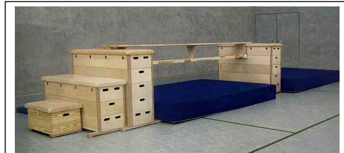
S. Bierögel, A. Hemming: Sternstunden im Kinderturnen. Ökotopia Verlag, Münster 2006. Karte 19.

Diese Fortbildung eignet sich für alle Altersstufen!